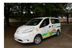
電気自動車イメージ