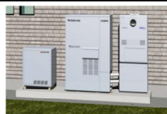
定置型蓄電池イメージ