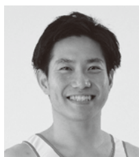
さかいりょうすけ 堺 亮介 選手

当イベントにオリンピックの堺亮介選手 栃木県スポーツ協会所属の山田大翔選手を お迎えします!