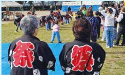
◀北小児童によるソーラン節