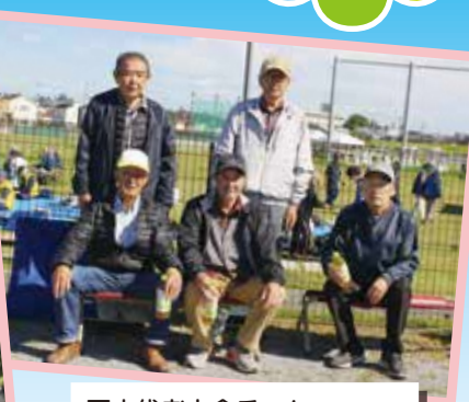
西木代老人会チーム 輪投げ 総合得点845点