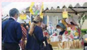
◀食事サービスボランティアによる活動の様子