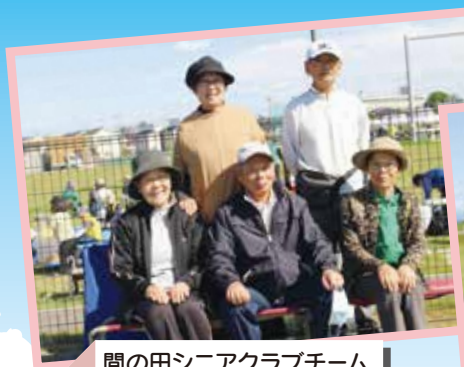
間の田シニアクラブチーム ベタンク2回戦進出