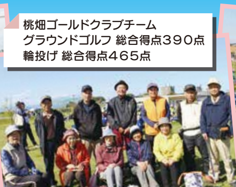
桃畑ゴールドクラブチーム グラウンドゴルフ 総合得点390点 輪投げ 総合得点465点