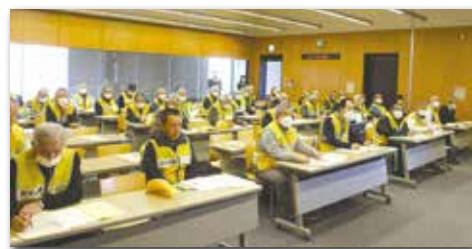
地域の安全見守り隊