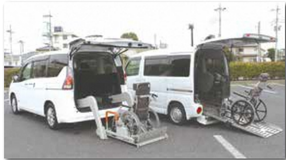
福祉車両の貸出し