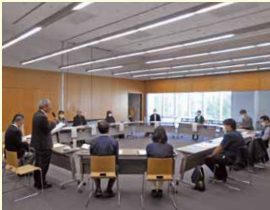
上三川町社会福祉法人連絡会対象法人

今後は、より一層社会福祉法人同士、顔の見える関係を構築し、高齢・障がい・児童と分野を超えた「地域における公益的な取り組み」を検討してまいります。