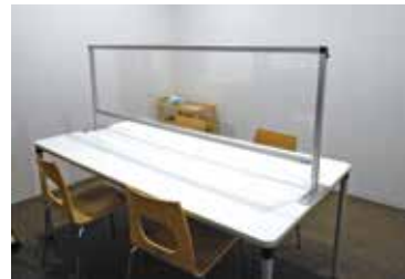
上三川いきいきプラザ 1階 共用相談室（看板が目印です）