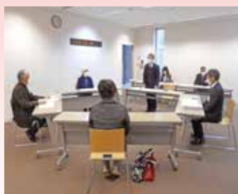
第2回評議員選任・解任委員会