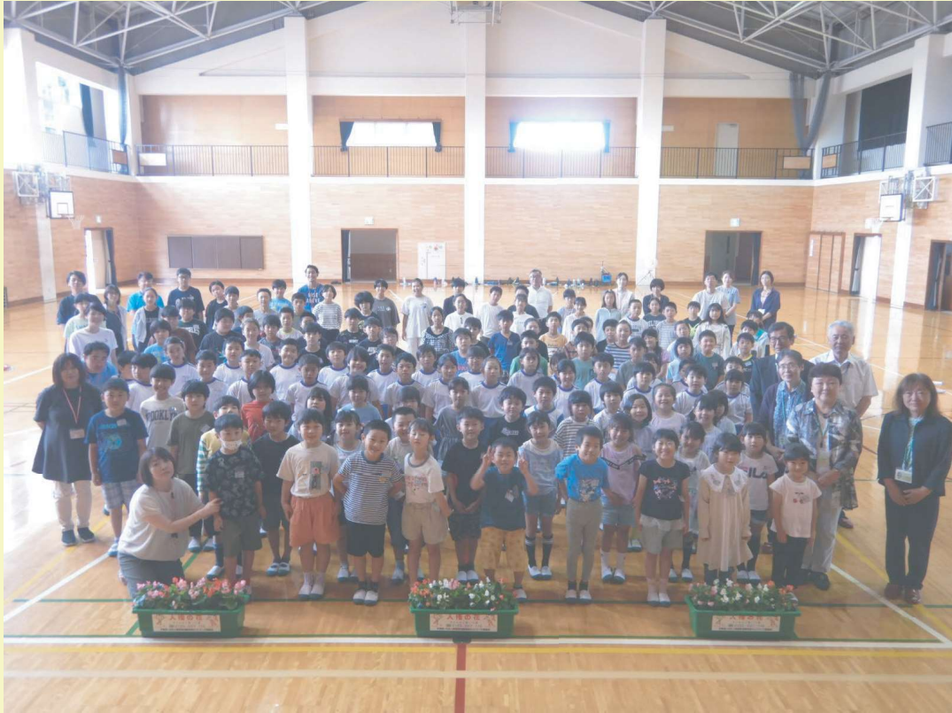
小学校における「人権の花」贈呈式