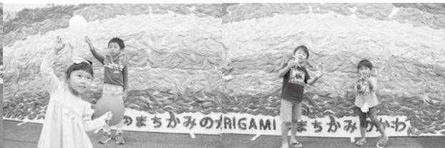
“何も見ず作ったよ!”