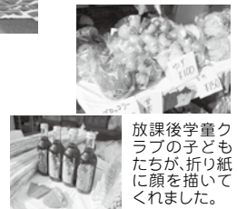
放課後学童クラブの子ど もたちが、折り紙 に顔を描いて くれました。

マルシェの店頭には、野菜のおりがみを作ってお渡したところ、貼ってかざってくださいました。今回のイベントは「新米まつり!」だったので、おにぎりやごはんの折り紙をたくさん作りました。「特産野菜の折れるおりがみ」で、装飾できてよかったです。