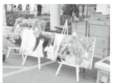
前回から引き続き、撮影し たパネルも飾られました。