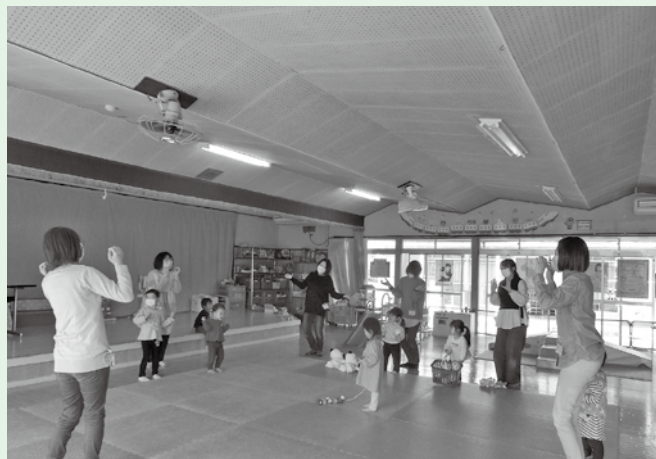
【3月のキッズサロンの様子】元気いっぱい踊りました。

※5月18日(木)・19日(金)の午前中は、ベビー・キッズサロンのため、 予約のない方の利用は午前9時から10時30分までとなります。