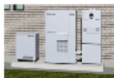
定置型蓄電池イメージ