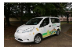
電気自動車イメージ