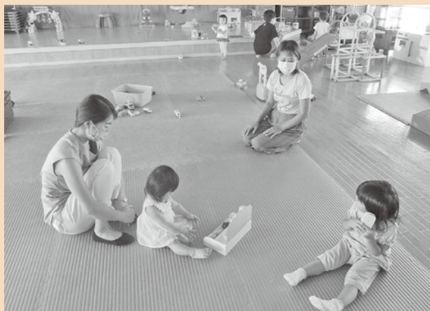
【普段の様子】 ママやお友達と一緒に楽しく遊んでいます。