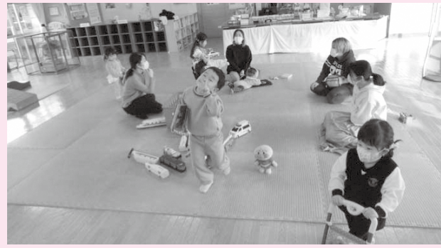
【普段の様子】お友達と楽しく遊んでいます。