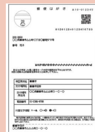
【交付通知書(ハガキ)】

申請者本人が、交付通知書に記載されている必要な持ち物を持参して、受け取りに来庁ください。