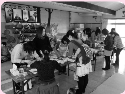
ひなまつり会で、押し寿司を作りました。