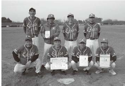
2部リーグ優勝の国分寺駅東