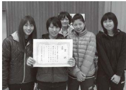
優勝したヴィーナス