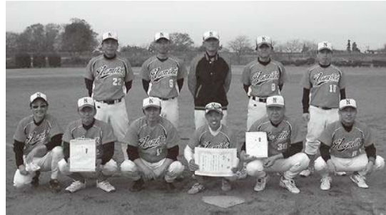
1部リーグ優勝の並木