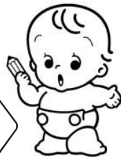
国勢調査 イメージキャラクター センサスくん

日本で最初に国勢調査が行われたのは、今から90年前の大正9年(1920年)のことでした。以来、おおむね5年ごとに実施され、今回で19回目を迎えます。 国勢調査は単に人口などを調べるためにだけ行われるものではありません。就業・不就業の状況、産業構造の変化、正規非正規や派遣労働など雇用形態の実態、地域別の人口・世帯の分布などを把握します。国連(国際連合)は世界各国に勧告を行っており、我が国の国勢調査は、その一環として実施されるものでもあります。