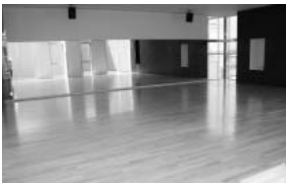
エアロビクススタジオ