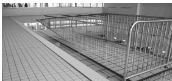
プール…スロープ付です

お子さんからご高齢の人まで障がいの有無にかかわらず、だれもが気軽に安心して利用いただけるよう、様々な工夫を凝らした施設づくりをしています。乳幼児をお連れの人のために授乳室や親子トイレはもちろん、車椅子の向きを変えずに乗り降りできる二方向入り口タイプのエレベーター、多目的トイレ（オストメイト対応型）などを設置しております。