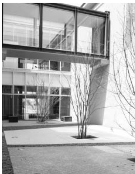
中庭…自然光を取り入れ省エネ効果も

また、太陽光発電や夜間電力による蓄熱システムなどを導入し、二酸化炭素の排出削減により地球温暖化防止にも努め環境に配慮した施設になっています。