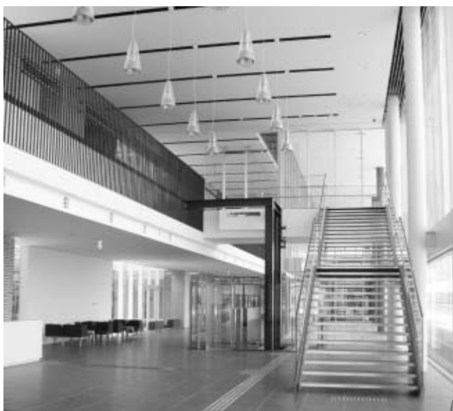
メインエントランス…二方向エレベーター設置

お子さんからご高齢の人まで障がいの有無にかかわらず、だれもが気軽に安心して利用いただけるよう、様々な工夫を凝らした施設づくりをしています。乳幼児をお連れの人のために授乳室や親子トイレはもちろん、車椅子の向きを変えずに乗り降りできる二方向入り口タイプのエレベーター、多目的トイレ（オストメイト対応型）などを設置しております。