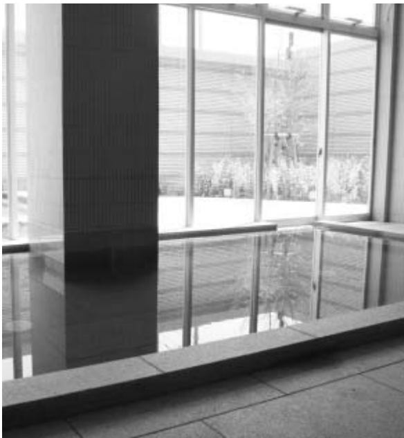
浴室…露天風呂も併設しています