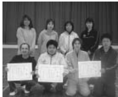
ニユースポーツ大会で優勝した(左から)並木新生ビーンズ、ブラボー、ゆうきが丘A