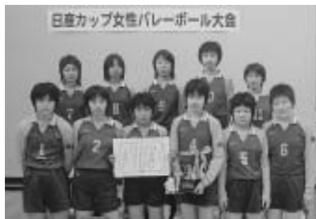
優勝した上三川中学校