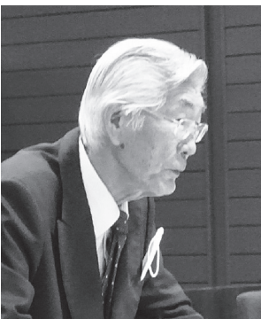
しづり 志鳥 議員 しづり 志鳥 議員

③ 広域に町の魅力を発信する拠点とすることで、町のブランド力の強化や観光需要の創出に繋げる。以上、3点を大きな目標として、今後進めていく基本構想・基本計画の策定において、より良い「道の駅」となるよう、十分に検討していきたいと考えています。