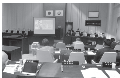
久喜市議会にて研修中の様子

また、デジタル化に向けた議会を進めていくためには、執行部と連携しながら議会改革検討会で十分に議論を進めて行かなければならないと感じた。