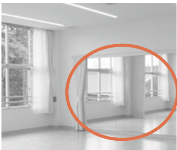
多目的室2(面姿見鏡)