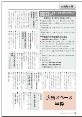
広告スペース 半枠