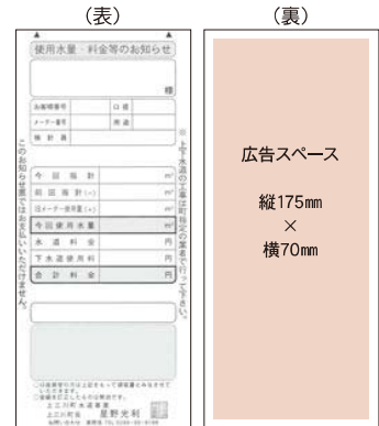
広告スペース 縦175mm × 横70mm

▼申し込み・問い合わせ先=●広報かみのかわ、ホームページは 企画課 情報広報係 ☎9117