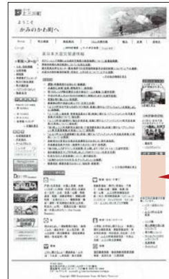
ここに掲載されます