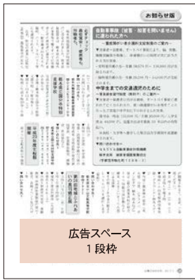
広告スペース 1段枠