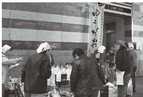
上三川の美味しい野菜はいかがですか～!

県庁からの地産地消の情報発信を目的に毎月1回開催されているもので、県内各地から生産者が集いとても賑やかです。このような中、ひととき大きな声で『上三川』を売り込んできました。