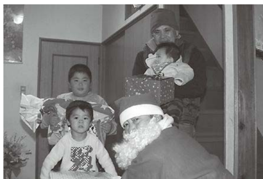
サンタさんとハイポーズ!

抽選で選ばれた30組の家庭に、サンタクロースに扮したボランティアがクリスマスプレゼントを届けました。子どもたちは、サンタクロースの登場に大興奮、大喜びでプレゼントを受け取っていました。