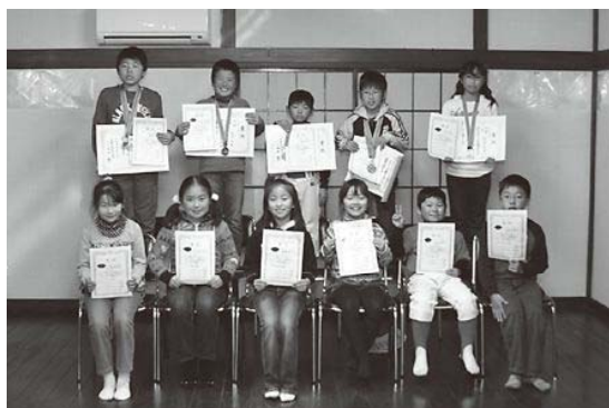
2011年全国そろばん大会で優秀な成績を収めた皆さん