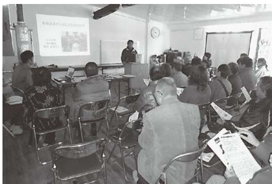
有機農業の講演を熱心に聞く参加者の皆さん