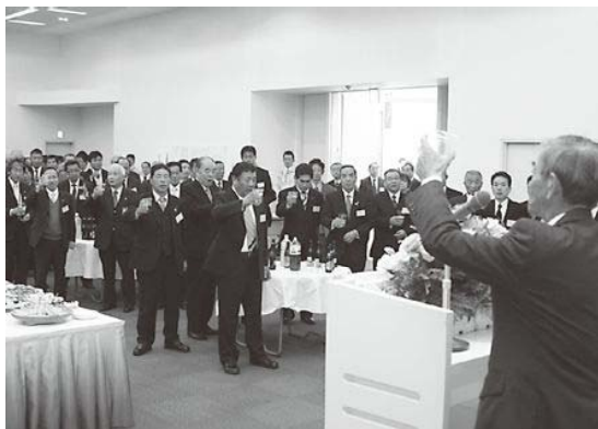
今年も良い年になりますように「乾杯!!」