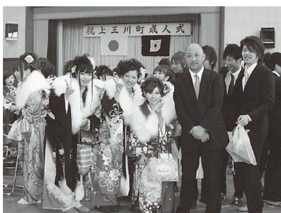
式典後、恩師と一緒に記念撮影