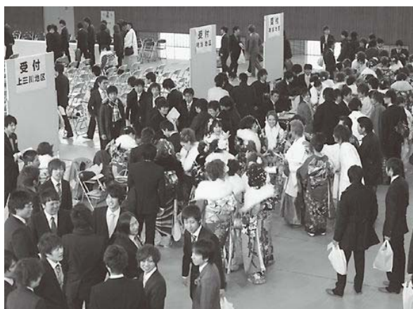
受付をし、久々の再会を喜ぶ新成人たち