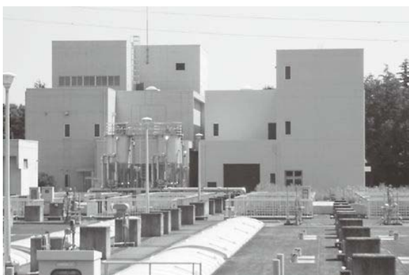
仮置き保管を行う建物の外観

なお、栃木県県央浄化センター内の空中放射線量率の測定結果は、栃木県及び町のホームページで毎日公表されております。