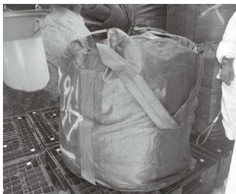
溶融スラグ等の梱包の状況