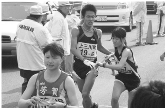
力走を見せた町代表選手達