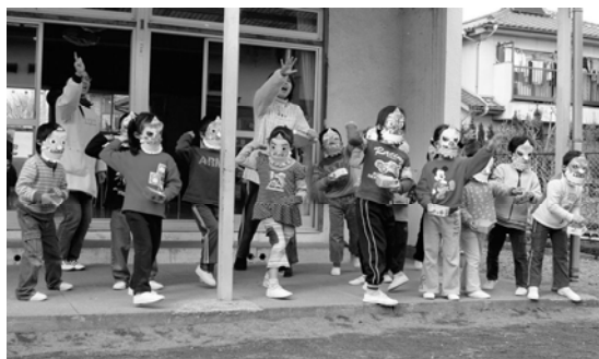
元気に豆まき「鬼は～外～!!」