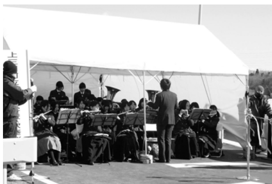
开通式に彩りを添えた明治中学校吹奏楽部