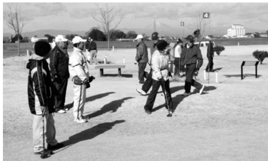
晴天に恵まれたパークゴルフ大会