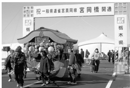
山車も一緒に渡り初め