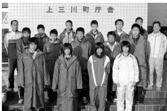
町代表として選抜された選手達

町内から選抜された選手たちは、昨年秋から練習を重ね大会に参加、町代表にふさわしい力走を見せてくれました。