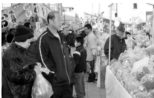
どのだるまを買おうかな?