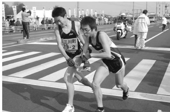
「あとは任せた!」「よし、任せろ!」