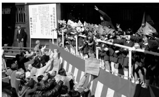
豆まき会場は大盛り上がり

また、午前の部にはしらさぎ幼稚園の園児たちも豆まきに参加し、元気いっぱい豆を投げていました。