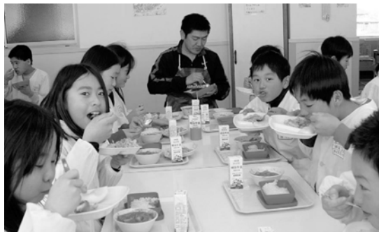
玉ねぎドレッシング、おいし〜よ!

試食会では、子どもたちの元気な声とともに、ドレッシングを使ったサラダが、あっという間に食べられていました。