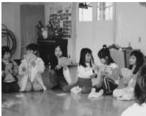
お正月お楽しみ会 (願成寺児童館)